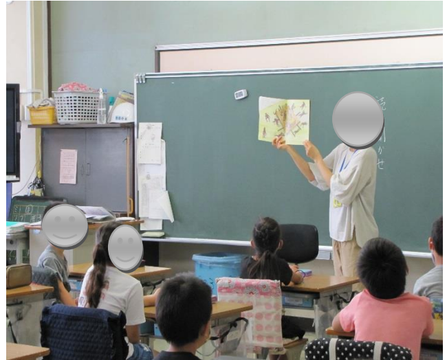
大型絵本、紙芝居、 図書室で借りられます