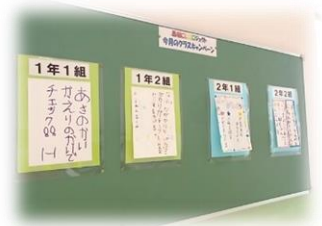
各学級の取組宣言