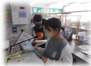
6年生による中間報告