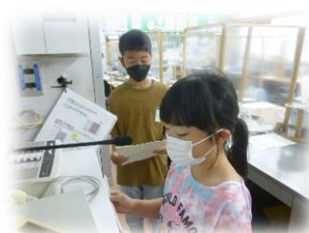
4年生による全校への周知

今後も、生活目標を活用し、児童自身が試行錯誤しながら、課題に対しての解決策を自分達の手で考え、解決に導いていく力を身に付け、「もうひとがんばりできる子」に近づけるよう、学校全体で取り組んでいきたいと思ひます。