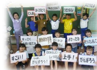
周知の動画出演者 4年生