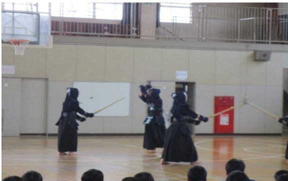
部活動オリエンテーション