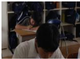
「漢字の鉄人」に参加する小学生