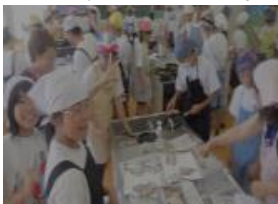
お魚まるごと探検講座

2日間で、延べ80名ほどの方々にお越しいただきましたが、今回の特色は地域の方々の参加が非常に多かったことです。保護者の皆様にも、お忙しい中、様々なご協力をいただき、ありがとうございました。