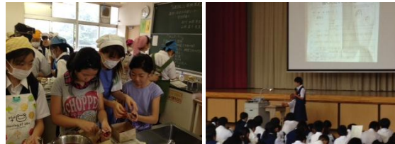
お魚まるごと探検講座に参加する小学生 1年生 クラス代表の発表のようす

今年のサマーセミナーはあいにくの天候で、参加人数が少なかったのですが、小学生なども授業に参加し、中学校の生活を体験する良い機会となったと思います。保護者の皆様も、お忙しい中、様々なご協力をして頂き、ありがとうございました。